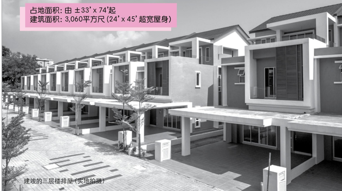
建竣的三层楼排屋 (实地拍摄)

占地面积: 由 \pm 33' \times 74' 起 建筑面积: 3,060平方尺 ( 24' \times 45' 超宽屋身)